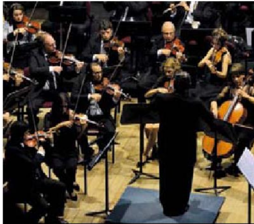
Orquesta Sinfónica de Entre Ríos - Creada en 1948, es una de las más prestigiosas.

C reada en 1948, la Orquesta Sinfónica de Entre Ríos es una de las más prestigiosas de la Argentina en la actualidad. Surgida ante la necesidad de canalizar la creciente actividad musical en la provincia y, en especial, la de su capital, Paraná, la concreción de su formación fue una idea que comenzó a rondar por los pensamientos de los funcionarios de cultura de la provincia desde finales del siglo XIX, y que se fue cristalizando a medida que el nuevo siglo avanzaba. Así fue que el 1 de octubre de 1933 el periódico El Diario de Paraná anunciaba la inminente constitución de la orquesta, hecho que se concretó finalmente quince años después, gracias al decreto fechado el 30 de junio de 1948, en el que se creó la Orquesta Sinfónica del Conservatorio Provincial de Música y Arte escénico. Desde ese momento, la orquesta desarrolló una amplia actividad, con los altibajos propios de las circunstancias sociales y políticas que ocurrían en el país. En 1978 comienza un período de estabilidad de la orquesta bajo la dirección artística del Maestro Reinaldo Zemba, quien en 2010 es reemplazado por Luis Gorelik, pasando Zemba a desempeñarse en el cargo de director honorario. Bajo la dirección de Gorelik, la orquesta tomó un nuevo impulso encarando una programación musical variada y a su vez audaz, al